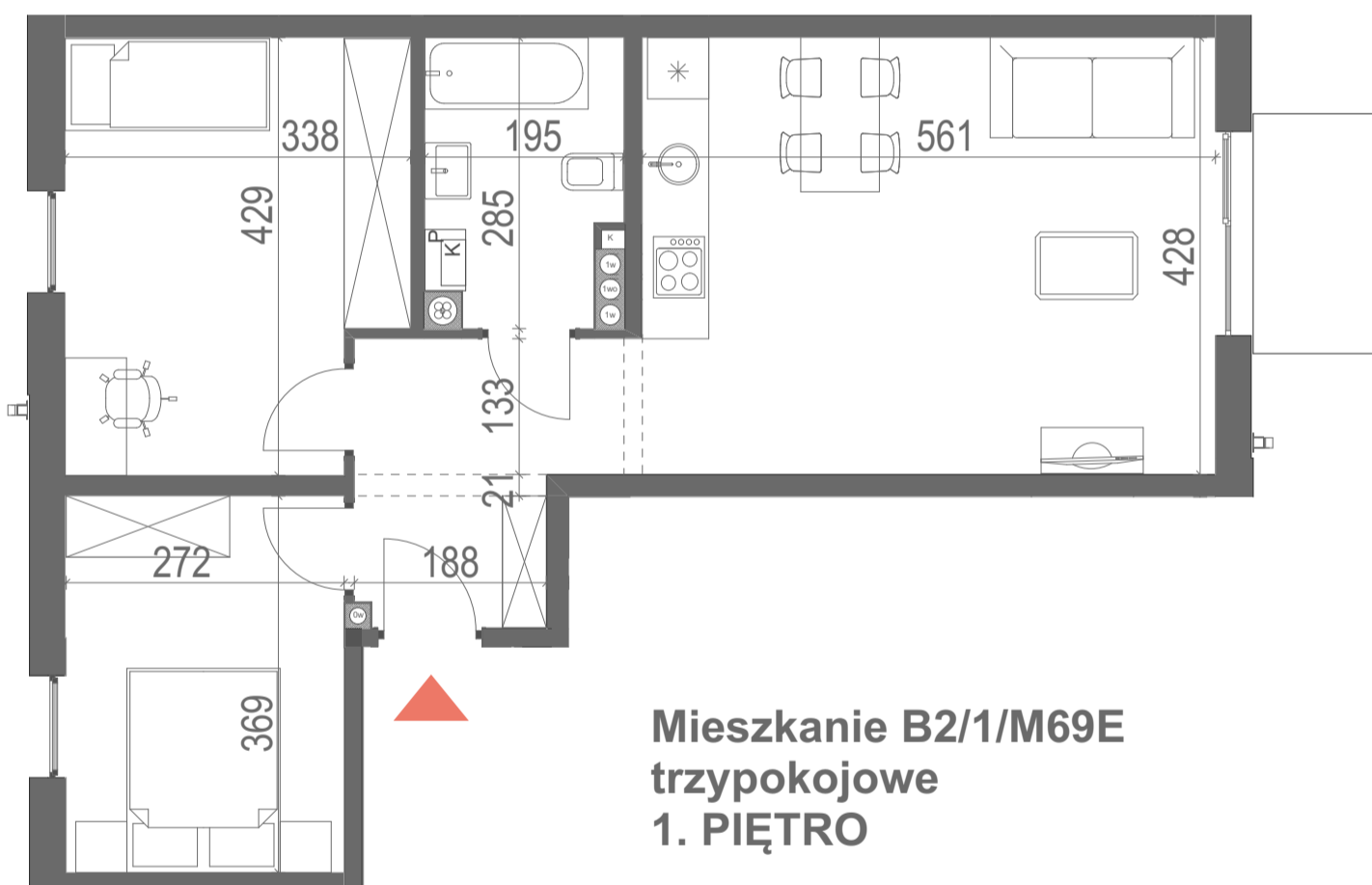
Mieszkanie B2/1/M69E trypokojowe 1. PIĘTRO